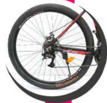
2.10 WANDA COMPASS