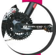
ALUMINIO CON REFLECTORES