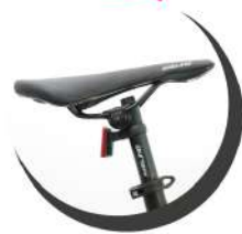
SILLIN MTB AVELINO BIKE