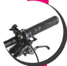
SHIMANO 21 VELOCIDADES